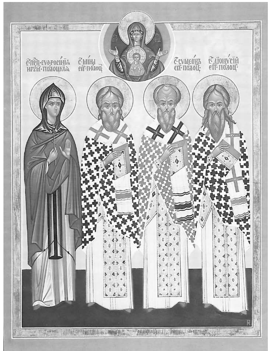
Святые угодники Полоцкой земли, 2010 год.

Выписка из фотоальбома «Храмы и монастыри Полоцкой епархии».