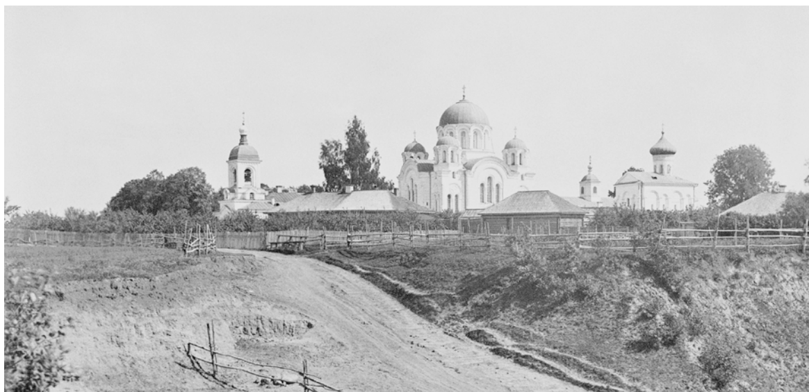
Спасо-евфросимиевский монастырь. Фото 1911-1912 гг.