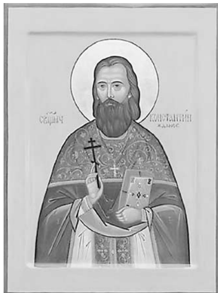
Священномученик Константин, пресвитер Шарковщинский (1919) был прославлен в лике святых угодников 4 июня 2011 года.

В Полоцкой епархии пять местночтимых святых угодников: преподобная Евфросиния, игуменья и княжна Полоцкая (1173), память 23 мая (ст.ст.)/5 (н.ст.) июня; святитель Мина, епископ Полоцкий (1116), память 20 июня (ст.ст.)/ 3 июля (н.ст.); святитель Дионисий, епископ Полоцкий (1182), память 23 июня (ст.ст.)/ 6 июля (н.ст.); Святитель Симеон, епископ Полоцкий (1289), память 3 (ст.ст.) / 16 февраля (н.ст.); священномученик Константин, пресвитер Шарковщинский (1919), память 16 (ст.ст.)/29 (н.ст.) апреля.